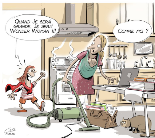
Source: André-Philippe Côté (9 septembre 2019). [Caricature]. Le Soleil.

Un comité des relations professionnelles (CRP) se tiendra avant la fin d'avril, et nous communiquerons par une nouvelle Ligne générale Express les informations d'intérêt en découlant.